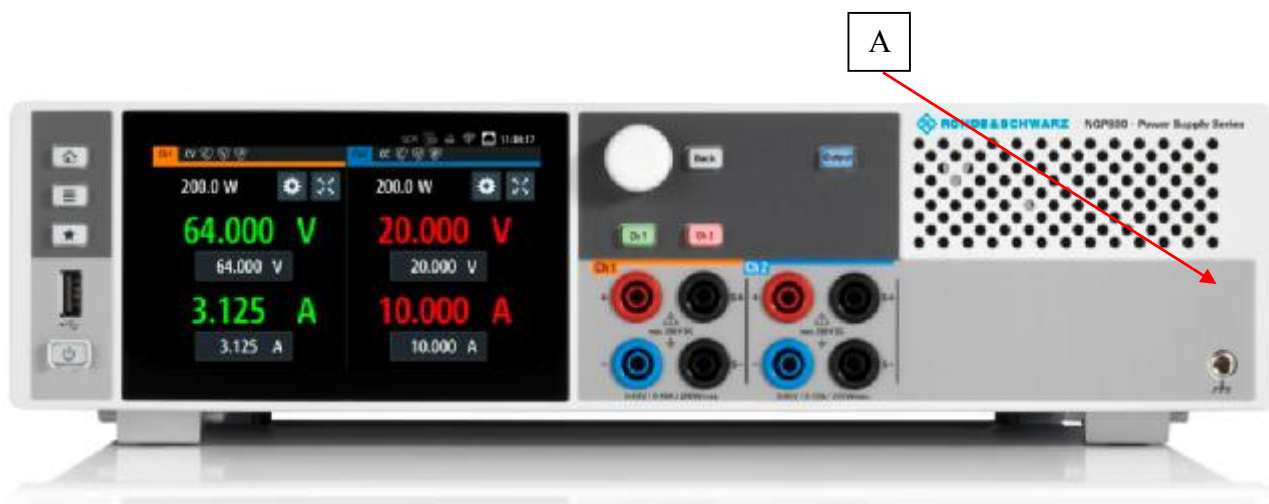
Рисунок 1 – Общий вид источников NGP802, NGP822, место нанесения знака утверждения типа (А)