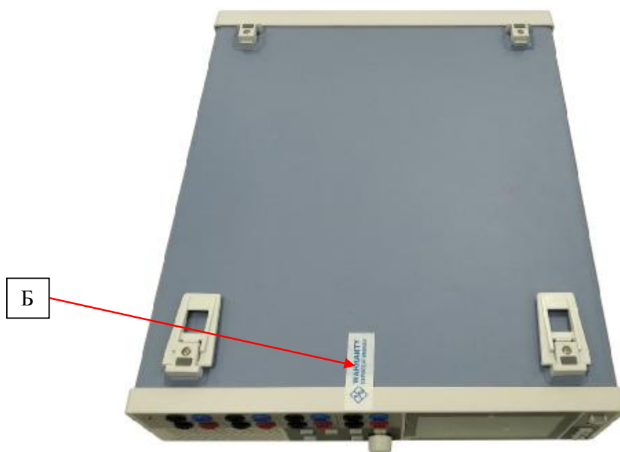
Рисунок 4 – Схема опломбирования источников (Б)