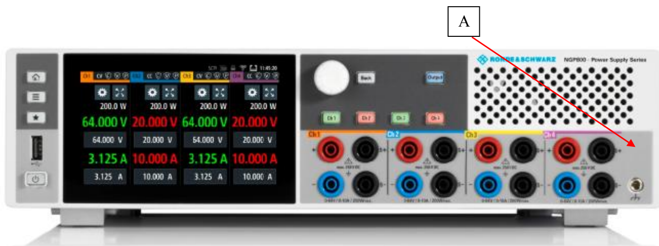
Рисунок 2 – Общий вид источников NGP804, NGP814, NGP824, место нанесения знака утверждения типа (А)